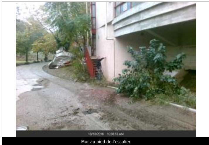
Mur au pied de l'escalier

Texte : Numero 1, Mur au pied de l'escalier Maximum de l'inondation : Oui Visibilité : Oui