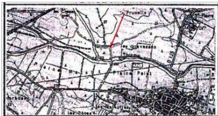
Croquis du site