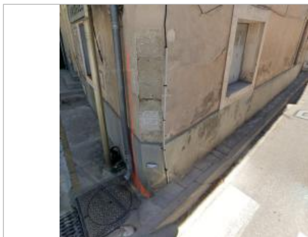
Vue du repère, juin 2024.