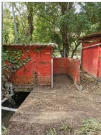
laisse sur les toilettes de la pisciculture

Altitude calculée de l'eau (en m) : 304.46