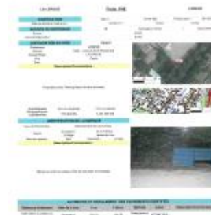
Fiche du site

Coordonnées RGF93 (ETRS89) : X: 3.3222775 / Y: 43.7347209