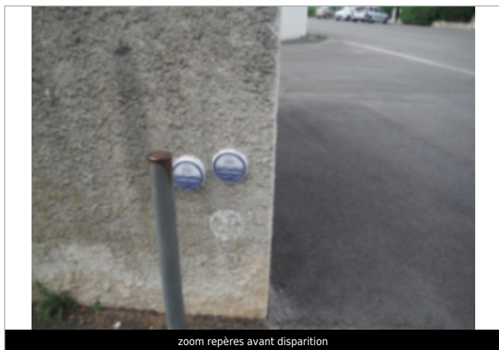
zoom repères avant disparition

Altitude calculée de l'eau (en m) : 2.42