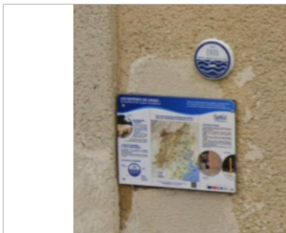
macaron place verdun