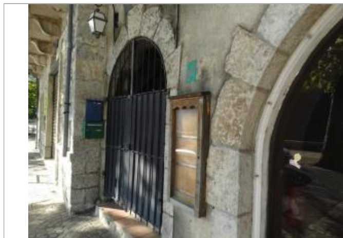
laisse au niveau serrure du menu