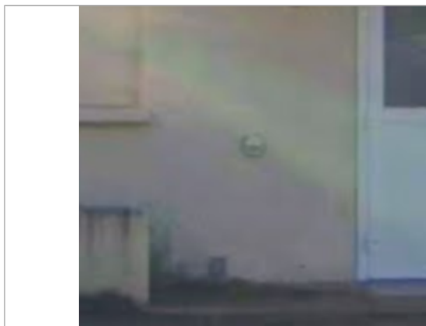
repere entree ancien camping