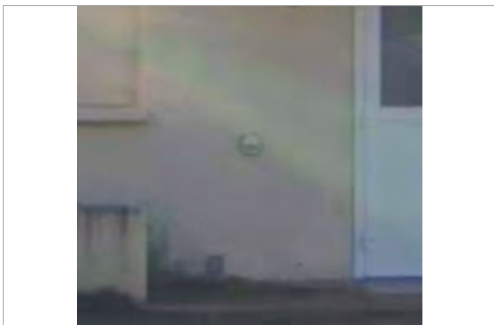
repere entree ancien camping

Code : DDTM_R_34126-064_0 Date de mise à jour : 19/06/2025