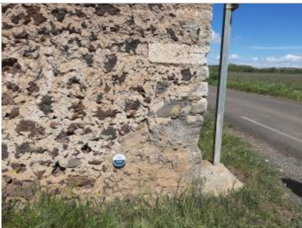
repere dans coin du bâtiment.

Altitude calculée de l'eau (en m) : 9.81