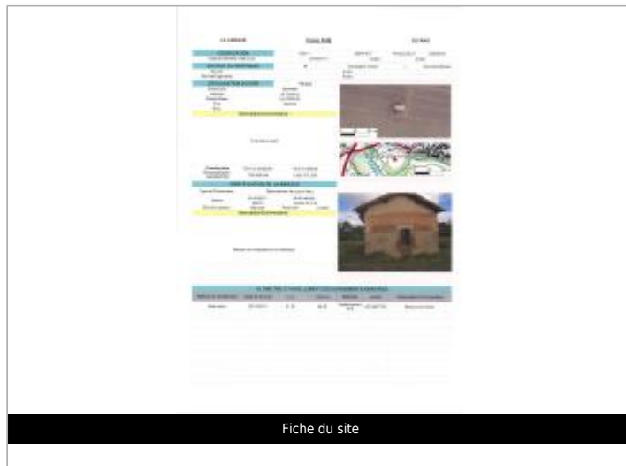
Fiche du site