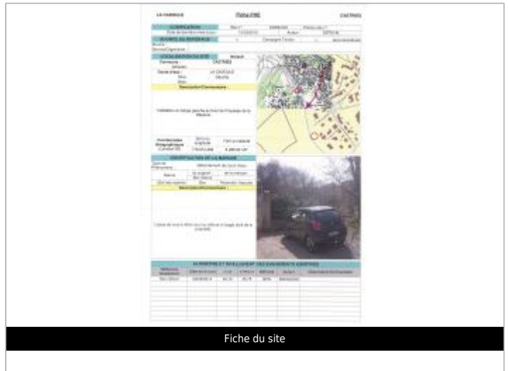
Fiche du site

Coordonnées RGF93 (ETRS89) : X: 3.9778341 / Y: 43.6744185