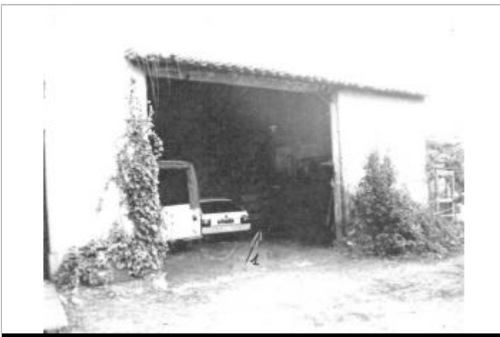
Photo du site

GÉOLOCALISATION Coordonnées WGS84 : X: 3.19634743 / Y: 43.35303800 Coordonnées RGF93 (Lambert 93) X: 715927.05 / Y: 6250452.77 Coordonnées RGF93 (ETRS89) : X: 3.1963474 / Y: 43.353038