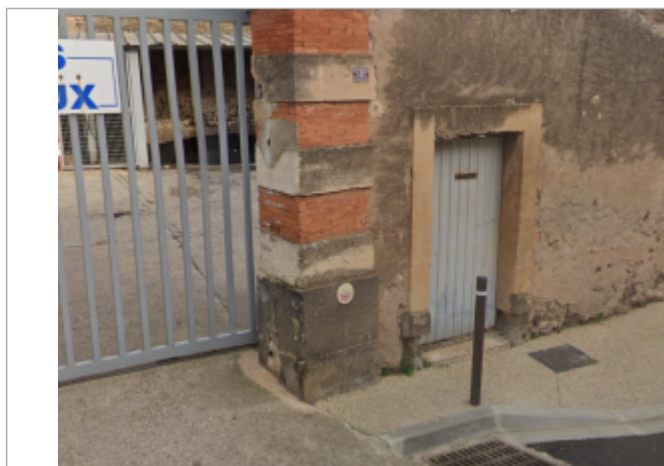
macaron crue 1907