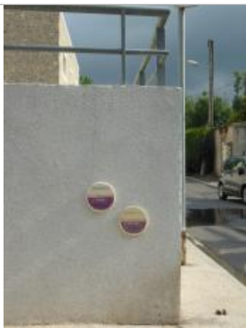
repère posé sur mur extérieur ehpad

Altitude calculée de l'eau (en m) : 6.97