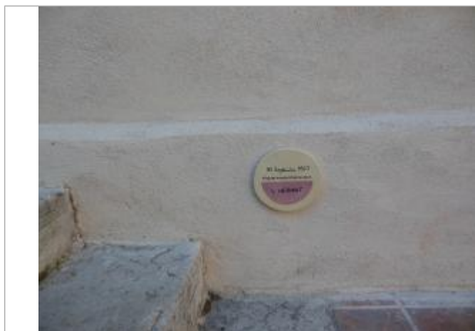
repere au niveau de l'escalier de la mairie