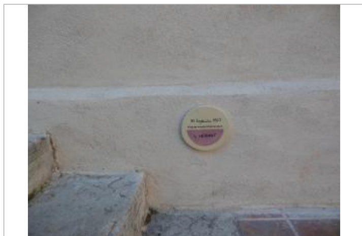
repere au niveau de l'escalier de la mairie

Altitude calculée de l'eau (en m) : 28.9