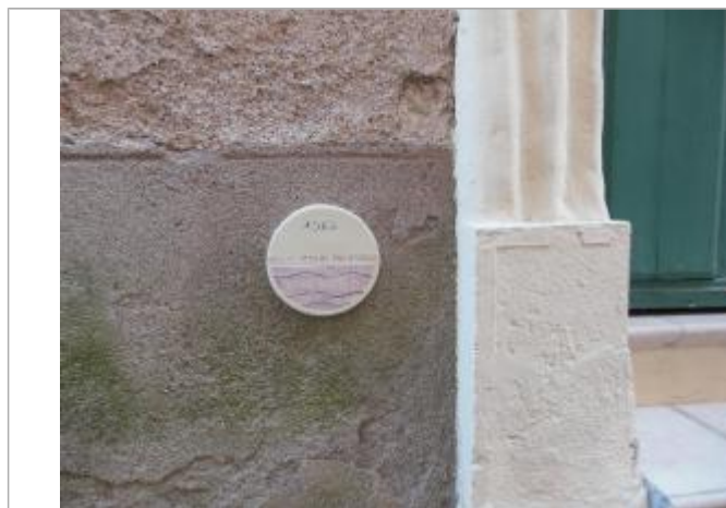
repere de 1963