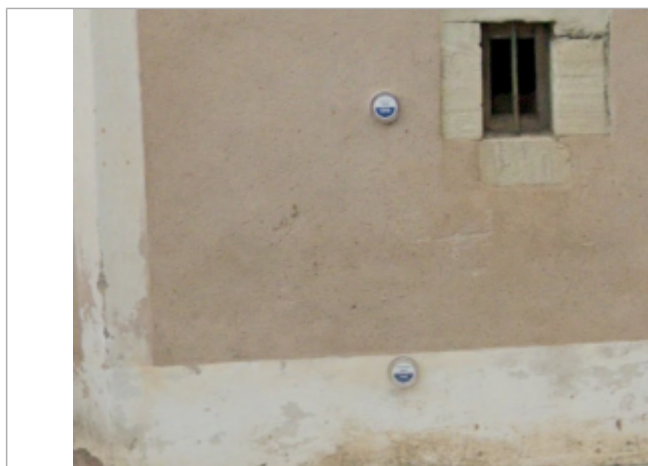
angle rue gassenc

Système altimétrique : NGF IGN 1969 (système normal)