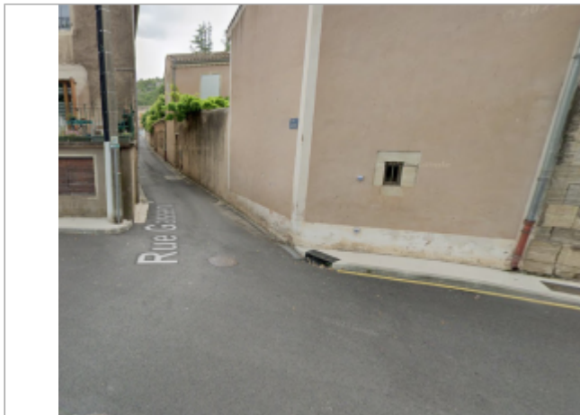
angle rue gassenc

Coordonnées WGS84 : X: 3.15584591 / Y: 43.61545330