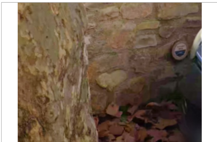
rue rene cassin

Maximum de l'inondation : Oui Visibilité : Oui État du repère : Bon Pérennité : Longue Repère calculé : Non renseigné PHEC : Non renseigné