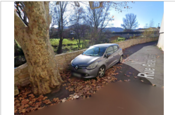
rue rene cassin