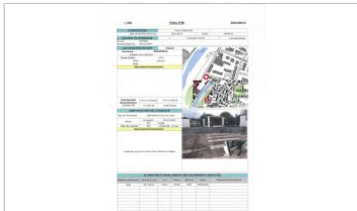
Fiche du site

Coordonnées WGS84 : X: 3.15418377 / Y: 43.61170650