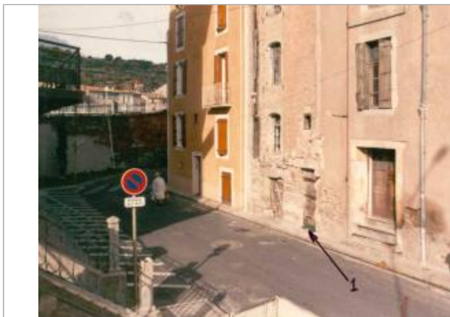
Photo du site