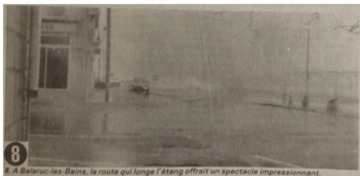
8. A Balaruc-les-Bains, la route qui longe l'étang offrait un spectacle impressionnant.