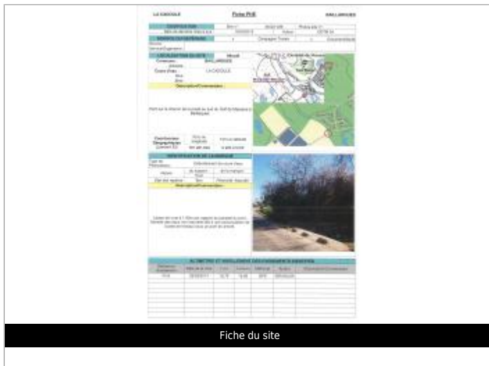
Fiche du site