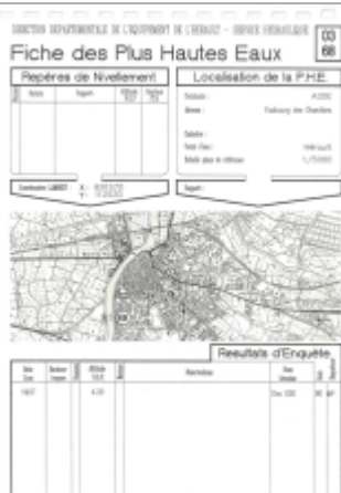
fiche faubourg des chantiers