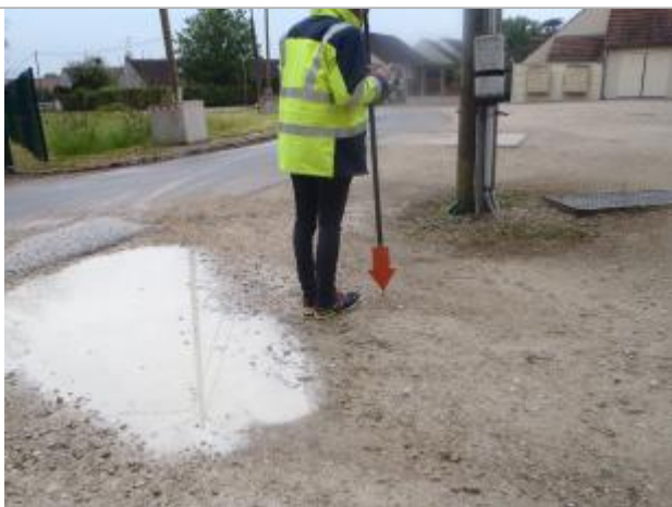
Repère (source : CEREMA Normandie-Centre)

Altitude calculée de l'eau (en m) : 102.37 m