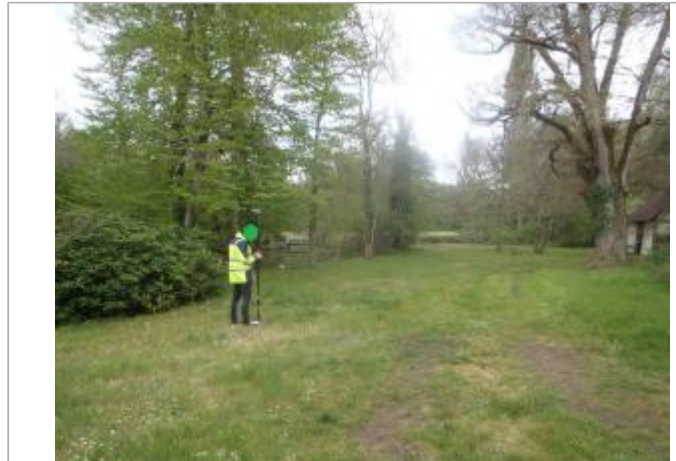
Site (source : CEREMA Normandie-Centre)

Coordonnées WGS84 : X: 1.84389800 / Y: 47.71722000