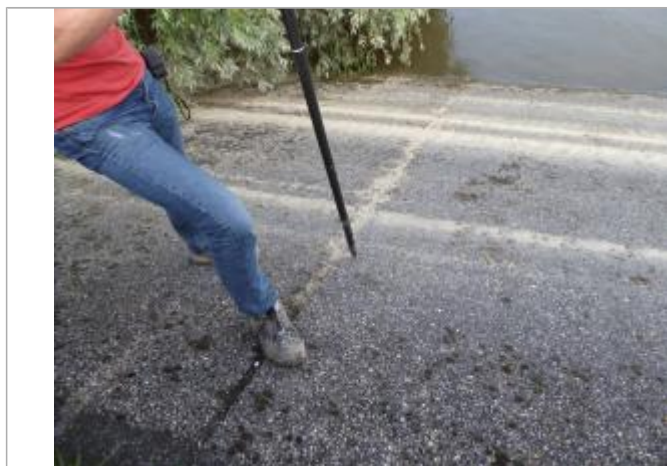
Vue du repère - Auteur : SCHAPI

Altitude calculée de l'eau (en m) : 32.443 m