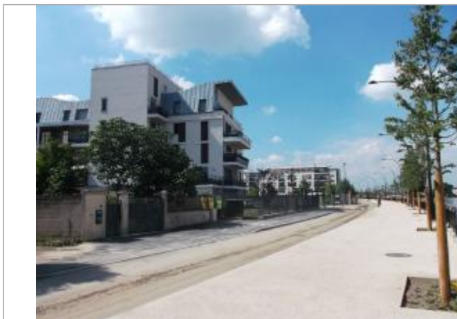
Vue du site - Auteur : DRIEE IDF