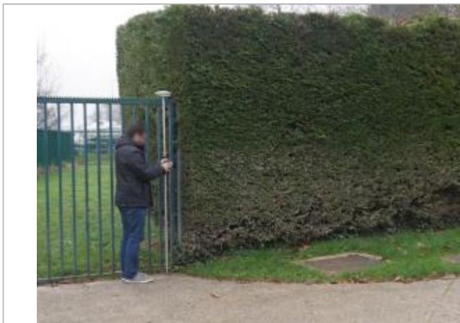
Vue du repère - Auteur : DRIEE IDF

Altitude calculée de l'eau (en m) : 35.387 m