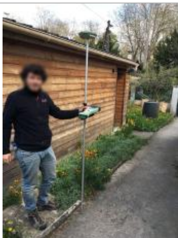
Vue du repère - Auteur : DRIEE IDF

Altitude calculée de l'eau (en m) : 36.548 m