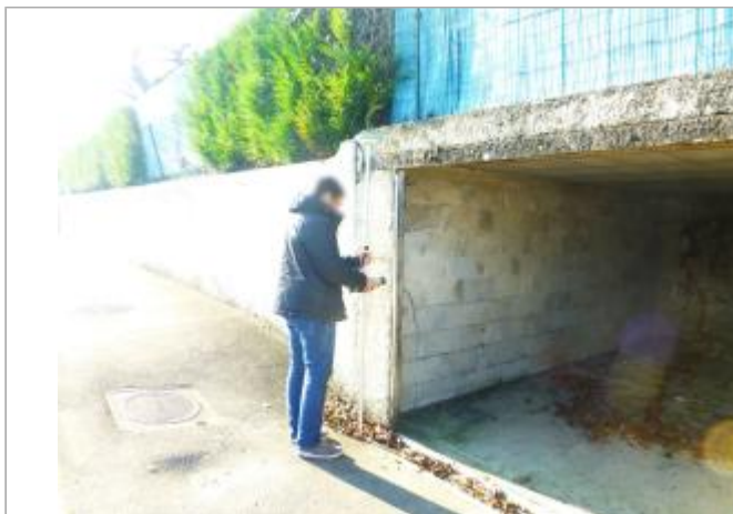
Vue du site - Auteur : DRIEE IDF

Coordonnées WGS84 : X: 2.48386378 / Y: 48.59443310