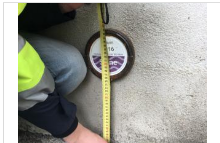
Vue du repère - Auteur : DRIEE IDF