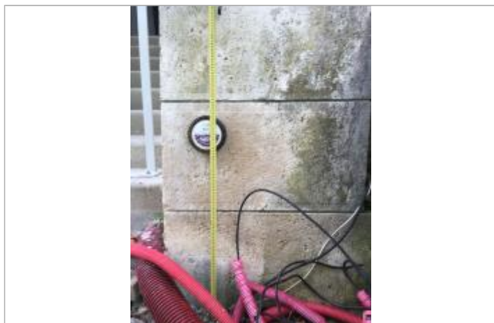
Vue du repère - Auteur : DRIEE IDF

SOURCE DE REPÉRAGE : RELEVÉ DE LAISSES SUITE À LA CRUE DE MAI/JUIN 2016 SUR LE BASSIN DE LA SEINE - 07/06/2016