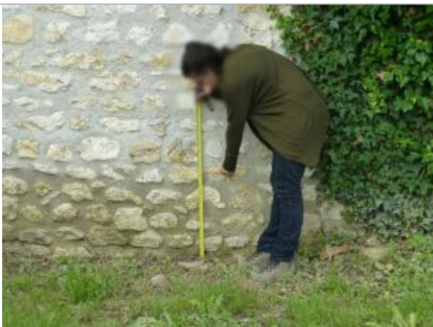
Vue du repère - Auteur : DRIEE IDF

Altitude calculée de l'eau (en m) : 46.357 m