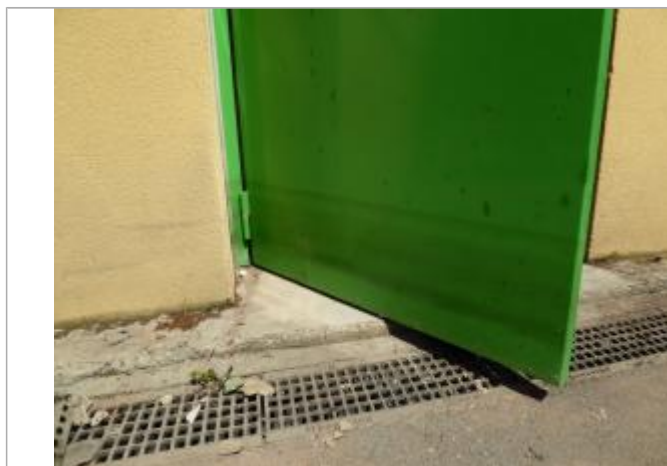
Vue du repère - Auteur : SCHAPI

Altitude calculée de l'eau (en m) : 32.981