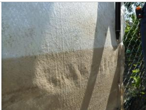
Vue du repère - Auteur : SCHAPI

Altitude calculée de l'eau (en m) : 32.52