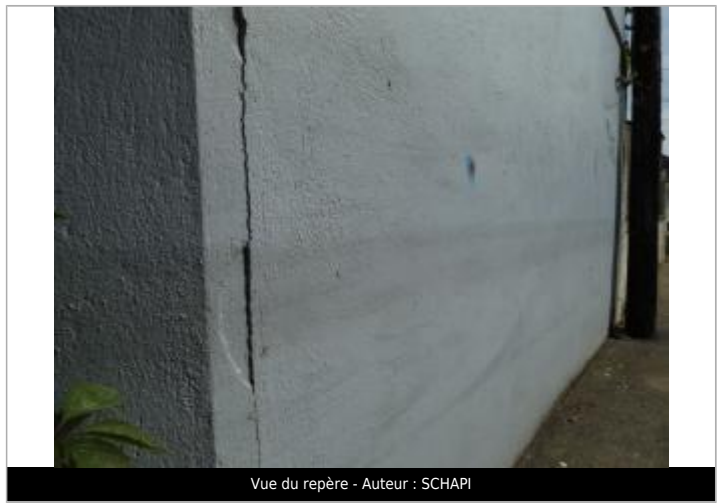
Vue du repère - Auteur : SCHAPI

MARQUE Maximum de l'inondation : Oui Visibilité : Non renseigné État du repère : Mauvais Pérennité : Aucune Repère calculé : Non renseigné PHEC : Non renseigné