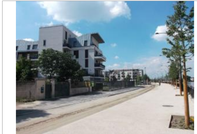
Vue du site - Auteur : DRIEE IDF

Coordonnées WGS84 : X: 2.44370038 / Y: 48.73456370