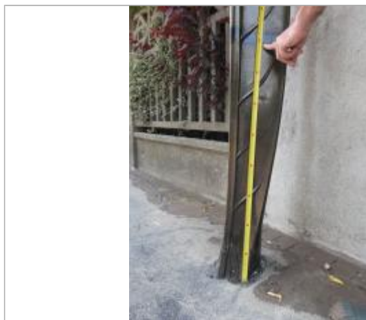
Vue du repère - Auteur : DRIEE IDF