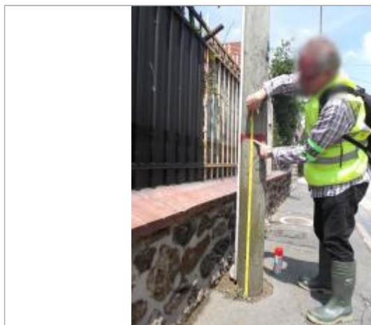
Vue du repère - Auteur : DRIEE IDF