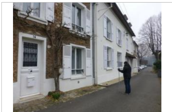
Vue du repère - Auteur : DRIEE IDF

Code : SMYL16_SM_R_112_1 Date de mise à jour : 02/07/2021 Auteur : SPC SMYL