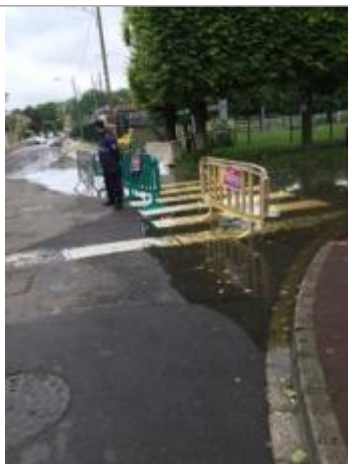
Vue du repère - Auteur : DRIEE IDF

Altitude calculée de l'eau (en m) : 35.407