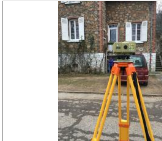
Vue du site - Auteur : DRIEE IDF