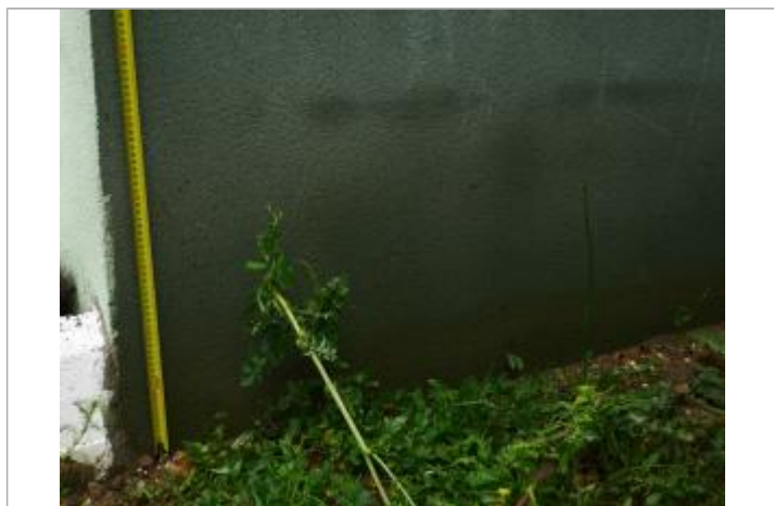
Vue du repère - Auteur : DRIEE IDF

SOURCE DE REPÉRAGE : RELEVÉ DE LAISSES SUITE À LA CRUE DE MAI/JUIN 2016 SUR LE BASSIN DE LA SEINE - 07/06/2016