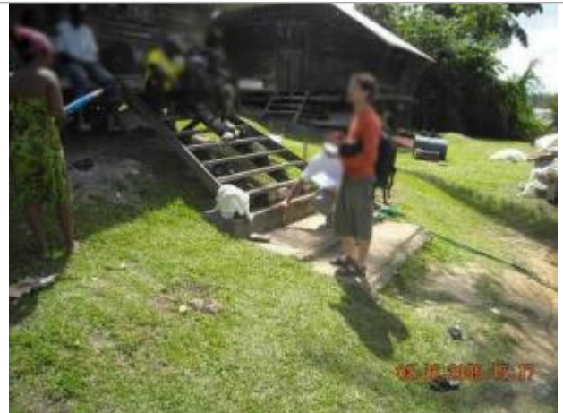
Vue globale du bâtiment