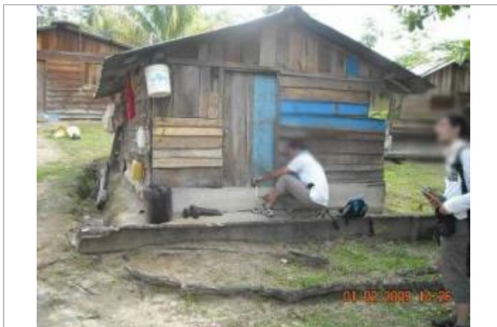
Vue globale du bâtiment