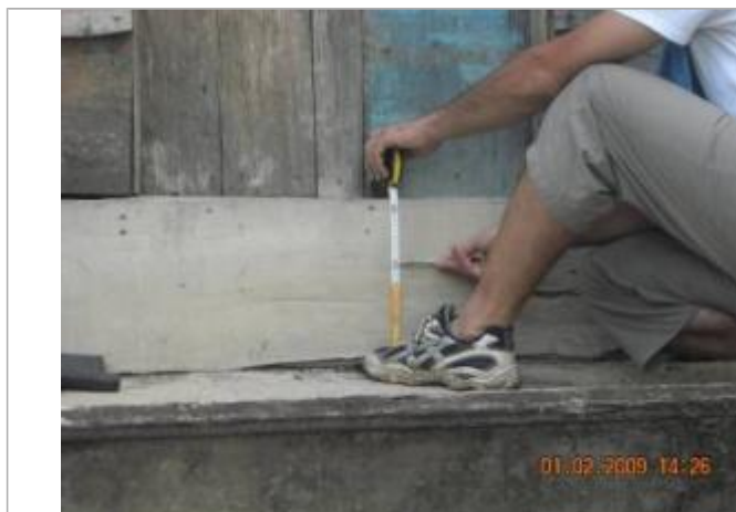
Vue du support et de la mesure du niveau des PHE

Différence entre le niveau d'eau et la référence (en m) : 0.200 m