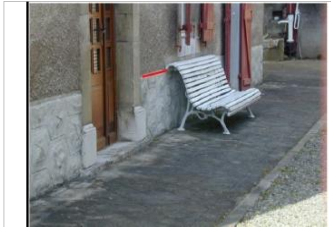
Vue globale du bâtiment