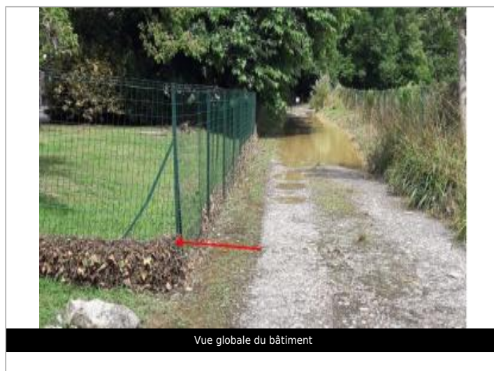
Vue globale du bâtiment