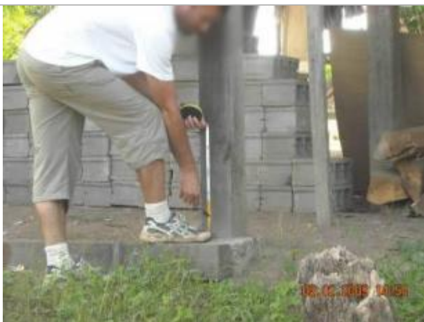
Vue du support et de la mesure du niveau des PHE

Différence entre le niveau d'eau et la référence (en m) : 0.100 m