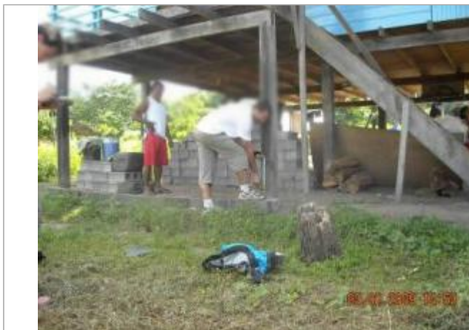
Vue globale du bâtiment

Coordonnées WGS84 : X: -54.00359600 / Y: 3.46519500