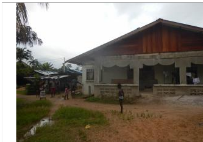
Vue du support de la mesure

Différence entre le niveau d'eau et la référence (en m) : 0.360 m